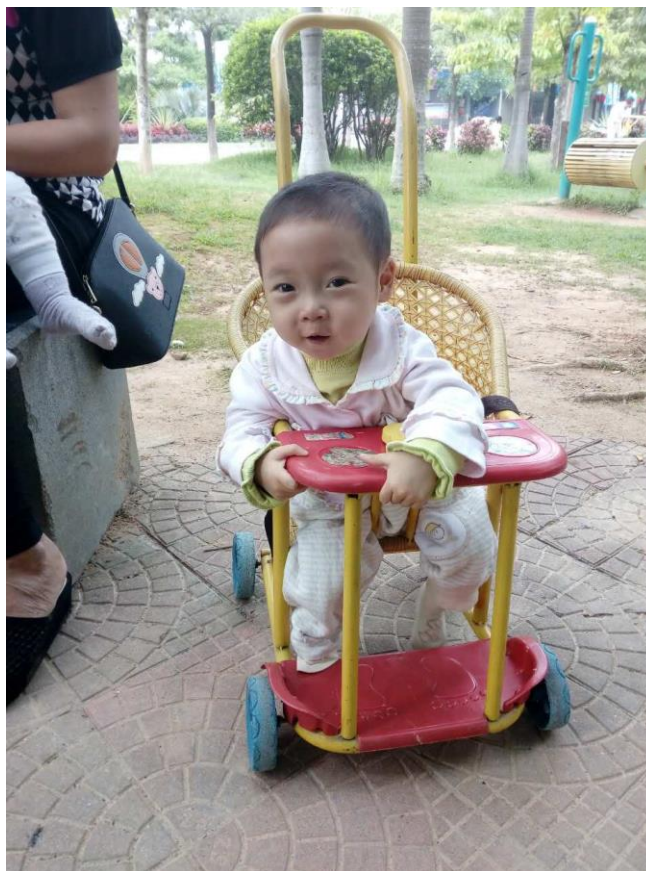
感谢神，孩子一次手术都没有动。上图是2017年5月份照片。